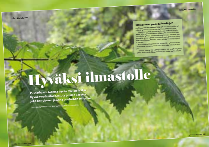
KOTI- JA MAASEUTU -LEHTI 1/2023: HYVÄKSI ILMASTOLLE