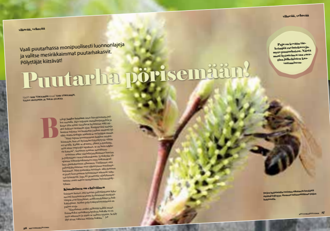
KOTI- JA MAASEUTU -LEHTI 2/2023: PUUTARHA PÖRISEMÄÄN

Puutarha ja piha ovat iso osa Koti ja maaseutua. Jokaisessa numerossa on ajankohtaiset vinikit vihreän ja vehreän hoitoon luontoystävällisellä otteella. Puutarhajutuista oppivat kaikki, vaikka viherpeukalo olisi keskellä kämmentä.